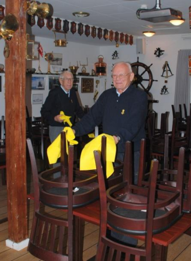
Finn tilbringer megen tid i baren!

Sensommeren går stille og roligt helt af sig selv. Vi mødes hver lørdag i Stuen og får os en snak over en sildemad og en øl.