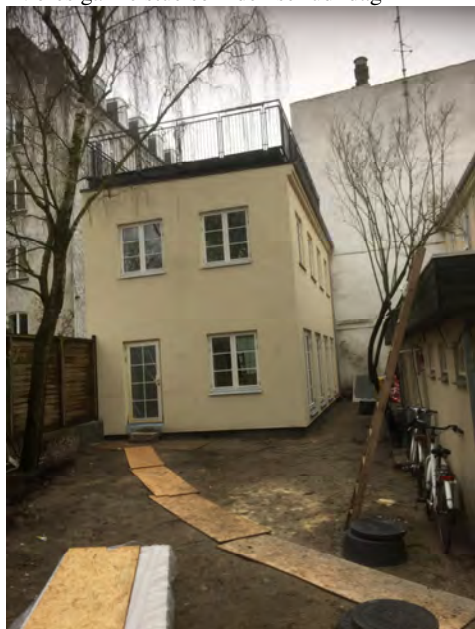
”Vores gamle stue som den ser ud idag”