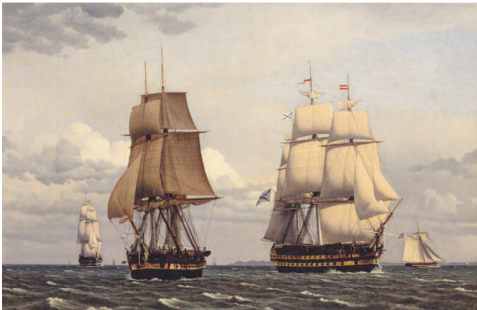
To russiske linjeskibe i Øresund